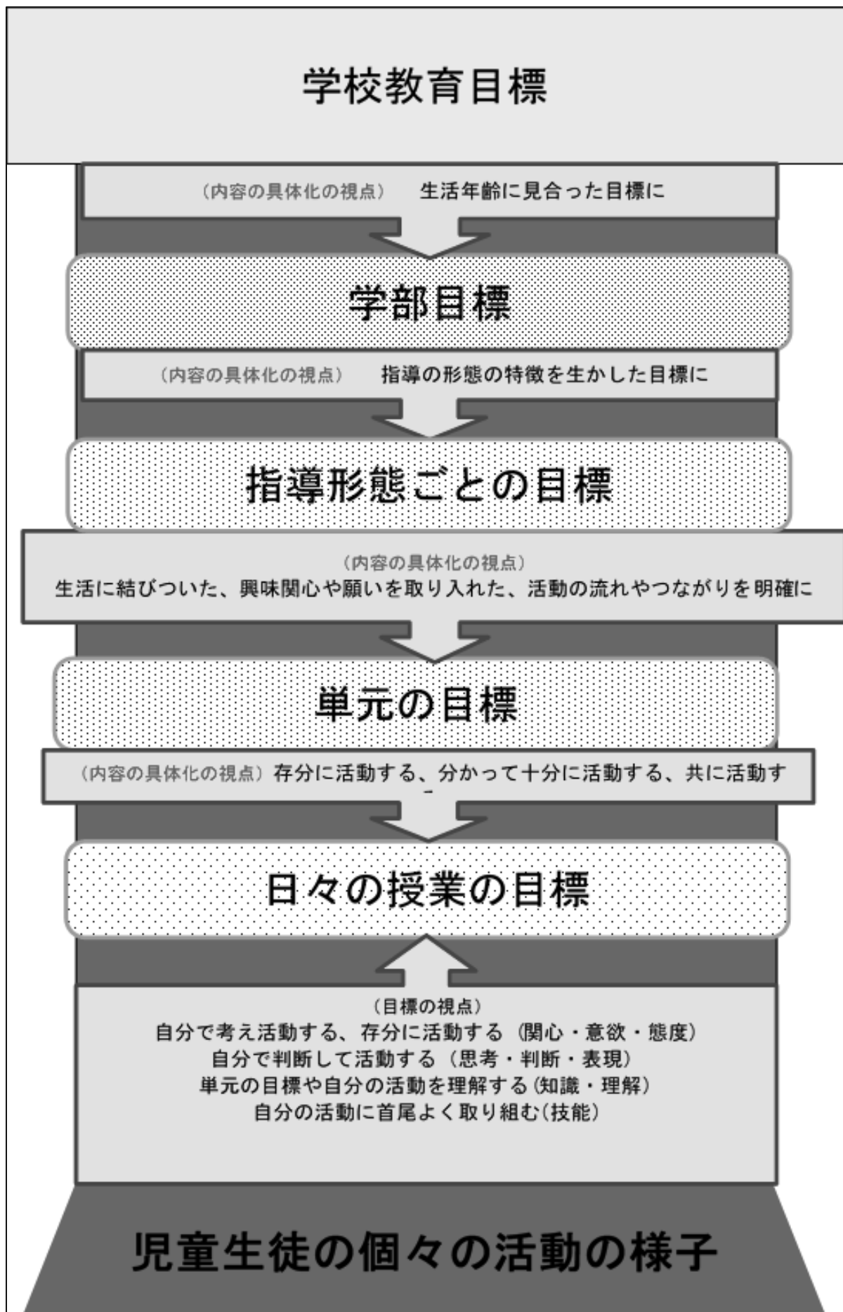
図2 学校教育目標と日々の授業の「主体的に活動する姿」のつながりの構想