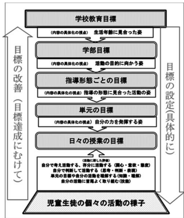
図－3 「主体的に活動する姿」のつながりの構想