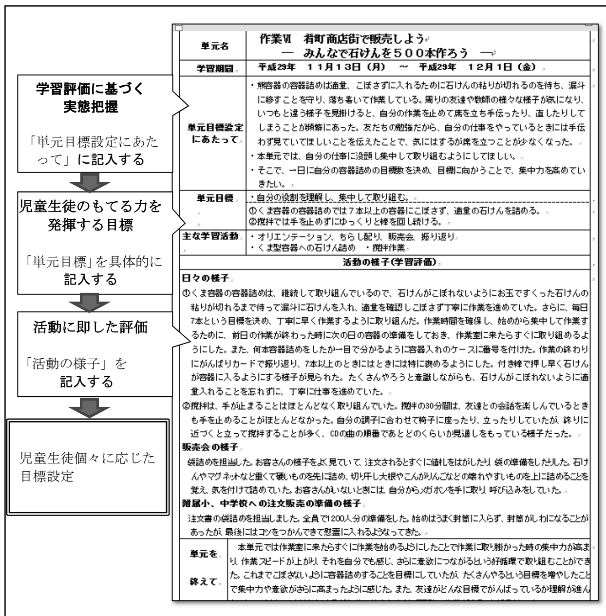
図-3 「評価シート」の例

日々の取り組みの過程を大切に評価する。単元の目標達成に向けた取り組みの過程で発揮された力を具体的に把握し、次の単元、あるいは今後の学習の目標設定の手がかりにできるように記入する。