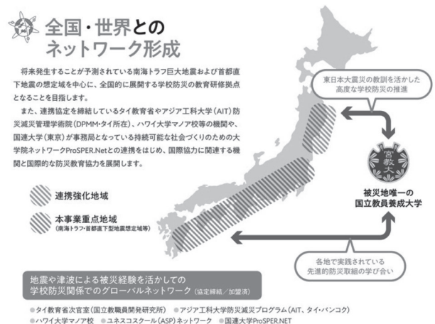
図1 防災教育研修機構の役割と連携強化地域