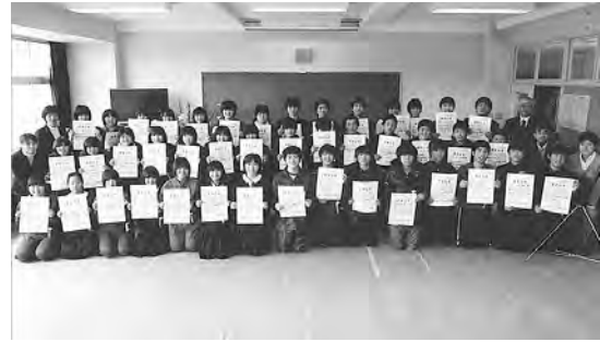
写真5 卒業式後の集合写真