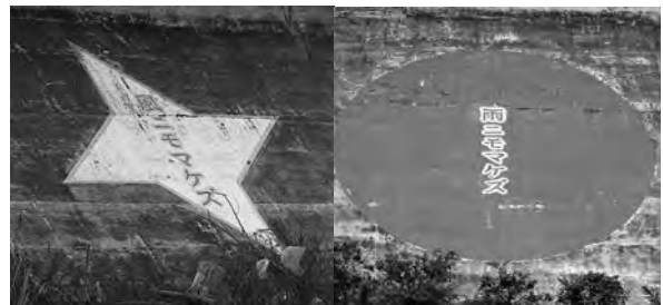
写真10 防浪堤にあった壁画

田老の22点の壁画は、メッセージ性が高く教訓を伝える力が満ち溢れていた。しかし、海側に存在していた。仮に財源と再製作の意志があれば、国道45号線の道路側から見える位置に描き、新たな復興の象徴として世界に発信してほしい。