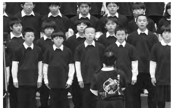
写真9 Tシャツを着て歌う生徒達

合唱を終えた瞬間、会場からは大きな拍手が沸き起こった。「霧が晴れて元に戻ってほしい、本当にそんな気持ちです。」と感想を述べた生徒がいた。また、家を失い市内のアパートに移り住んだが、一緒に震災を乗り越えた仲間と離れたくないとして、遠距離通学している生徒は「この歌詞の意味をみんなに伝えたい」と話した。