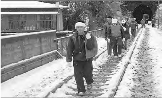
写真4 三陸鉄道で支援物資を運ぶ生徒たち (撮影日：2011年3月16日、撮影者：筆者)

老の復興のため、厳しい寒さの中、ボランティア活動に果敢に取り組む姿を見て、田老一中の生徒を誇りに思ったことは私だけではなかったと思う。