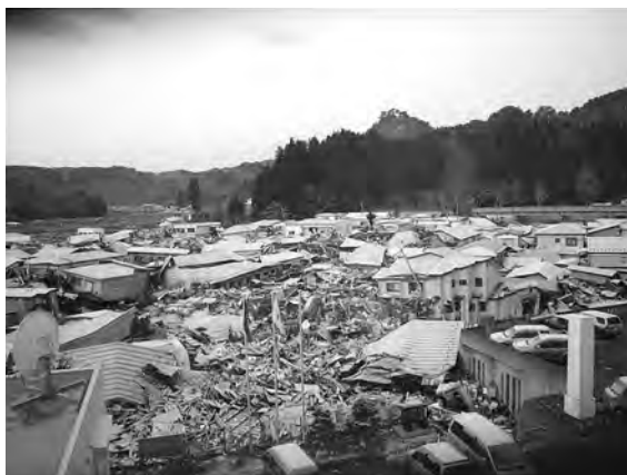
写真1 2011年3月12日5時30頃の田老町

2011年3月12日(土)、5時30分、避難先の田老総合事務所3階から撮影した一枚が写真1である。