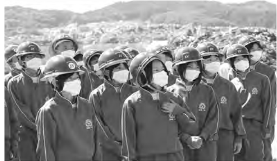
写真7 災害廃棄物破碎・選別作業見学(撮影：筆者)

復興教育推進上の大切な2つの視点を記述したい。1つ目は、本物を見せたり体験させたりすることの視点である。現実を直視させ、実感を伴う活動を実施したい。2つ目は、未来を描き前向きな意志を形成させるものでなければならない。この見学により、田老の生徒たちは、自ら復興に携わろうとする意志を形成し、未来に向かう力を育て高めることができたと確信する。9月は、作文集「いのち」の作成に向けて各生徒が作文をまとめる時期である。将来何をしなければならないのかを自覚し、そのために、今何をしなければならないかを自分なりに納得し本音で綴る素地ができたと思う。