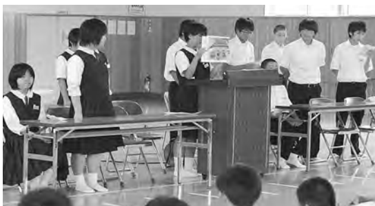
写真8 松園中学校で紙芝居「つなみ」朗読

復興教育では、前の通りの活動に戻すことではなく、新しい視点に立ち、質の高い教育活動にしようとする意識や願いが大切である。また、今までの活動が次の活動にどう影響を与え、繋がっていくかの視点を持ちながら、田老一中の復興教育を進めていきたい、と決意を新たにしたい。