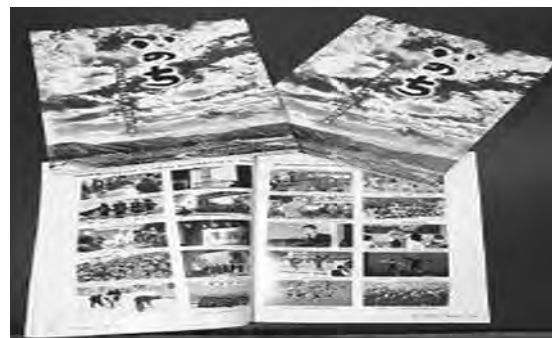
写真6 作文集「いのち」

それらの活動は、10年後、20年後、君たちが、社会で先頭になって活躍するようになる時代に、また大震災が起こるかもしれないと危機感を感じるようになる時に、岩手や日本の復興のために、みんなで力を発揮しなければならない時に、きっと役立つからです。何かの誰かのために、きっと役に立つからです。そして、2学期に様々な形で予定されている総合的な学習の時間の中に、文化祭に、田老一中ならではの、震災学校ならではの表現活動を展開し、一人ひとりが、何かを誰かにしっかりと伝え考えてもらうため、数多くのメッセージを伝えてほしいと思います。」