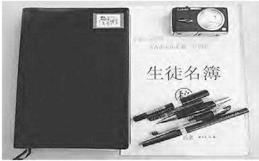
写真2 校長室から持ち出した実物

その理由は、「津波だ。逃げろ。」の声で一斉に避難を始めたが、何人かの生徒は、機転を利かせ、体育館の裏手から三鉄の線路を通り田老第一小学校方面へ避難したからだった。日頃から、学校周辺の地理に明るい生徒たちは、冷静に校舎周辺の状況を判断し、主体的に行動することで津波から自分の命を守ったのだ。当初、常運寺で人数の確認をした時には、焦りの色を隠せなかった。最終的に全員が無事であることがわかり、とても安堵したことは言うまでもない。